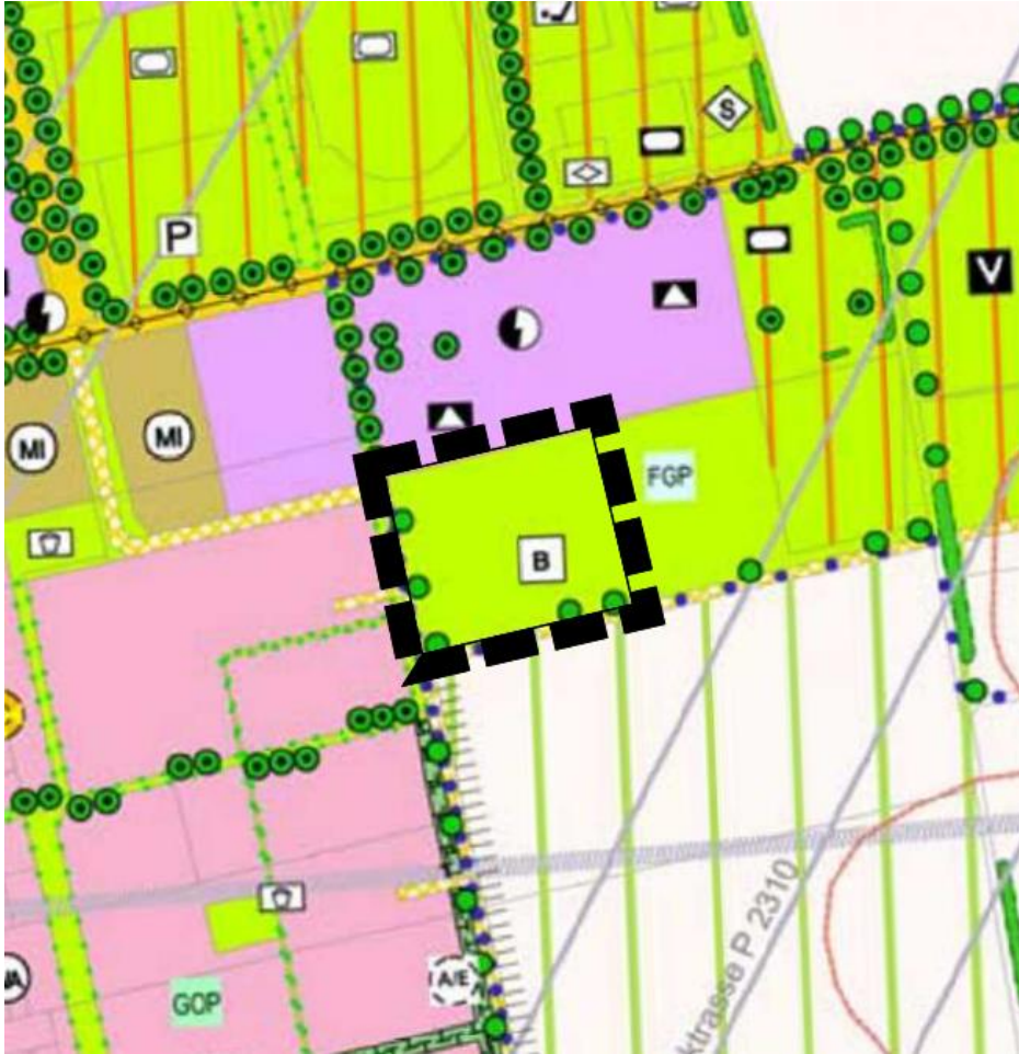
Neue Darstellung der Gemeinbedarfsfläche im Flächennutzungsplan